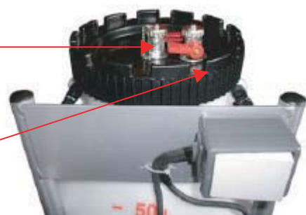
Grifo de purga del bidón

Tapa con grifo de conexión y grifo de purga. El grifo de conexión con tubo de cobre doblado hacia la pared del bidón. La curva que hace el tubo impide la formación de aire durante el proceso de purga del sistema, porque el medio corre a la pared del bidón.