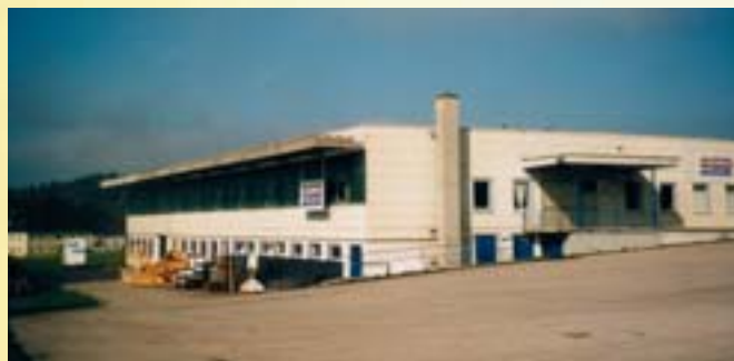
Fábrica de GASOKOL en Dimbach

Desde hace más de dos décadas, GASOKOL desarrolla y fabrica con gran éxito colectores térmicos y sistemas de almacenamiento solar. La larga experiencia acumulada en investigación, desarrollo y producción contribuye a satisfacer todas las necesidades y exigencias de nuestros clientes. La perfecta formación técnica de nuestro personal garantiza una instalación profesional y el mantenimiento de los sistemas GASOKOL. El empleo de las mejores materias primas y la más alta calidad de nuestros sistemas, hacen posible la creación de los mejores productos.