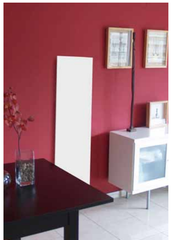
Doble efecto: convección del aire frío-caliente e irradiación frontal de calor.

AGUIDROVERT S.L. c/ Cervantes 20 Zaragoza 50.006 Tel.: 976302135 Fax: 976468085 www.aguidrovert.com info@aguidrovert.com